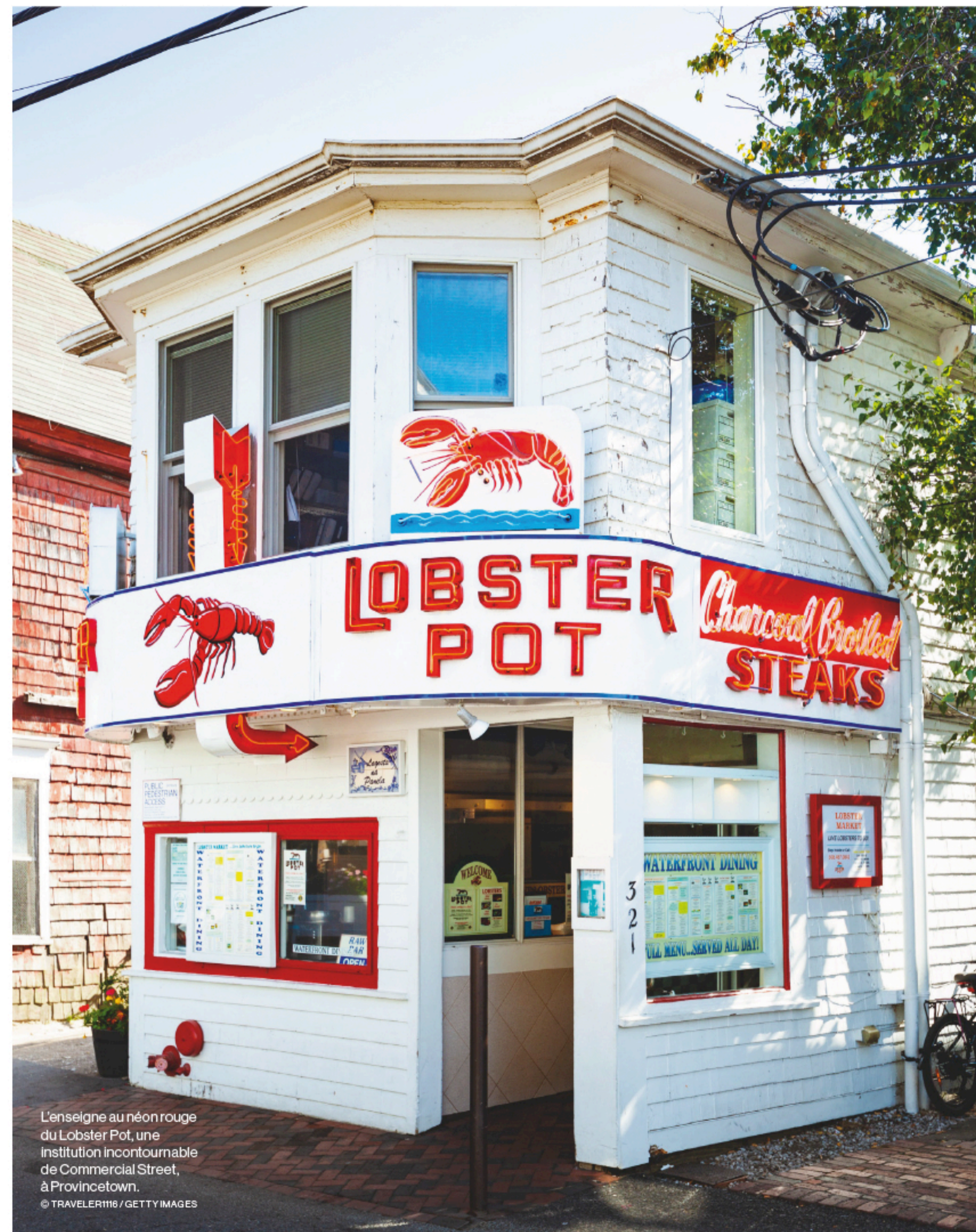
L'enseigne au néon rouge du Lobster Pot, une institution incontournable de Commercial Street, à Provincetown.

Le whale watching est l'activité phare de la péninsule. Au départ de Provincetown ou de Hyannis, des croisières (Hyannis Whale Watcher Cruises ou Dolphin Fleet Whale Watch) permettent d'observer baleines à bosse et rorquals. Compter 75 $ (64 €) par personne pour trois heures. Whales.net Whalewatch.com