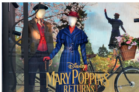
Mary Poppins fait la joie du grand magasin Harvey Nichols avant d'envahir les salles obscures.

Question gourmandise, pas de surprises. Les adresses incontournables restent Fortnum & Mason et Harrods. Dans l'antre de ces deux temples de la gastronomie, l'offre de thés, gâteaux, confitures ( lemon curd ) et puddings est étourdissante. Aux étages se dressent les marchés de Noël, royaume des décorations où il y a vraiment de quoi perdre la boule. Pour un sapin rock'n'roll, le grand magasin Selfridges propose des accessoires à l'effigie de David Bowie ou de Prince alors que, dans les rayons, des pères Noël version Freddie Mercury – Bohemian Rhapsody oblige, film dont la boutique éphémère vous accueille jusqu'au 6 janvier sur Carnaby Street – ou ZZ Top dépoussièrent l'image de notre barbu préféré. Pour notre plus grand plaisir. ♦